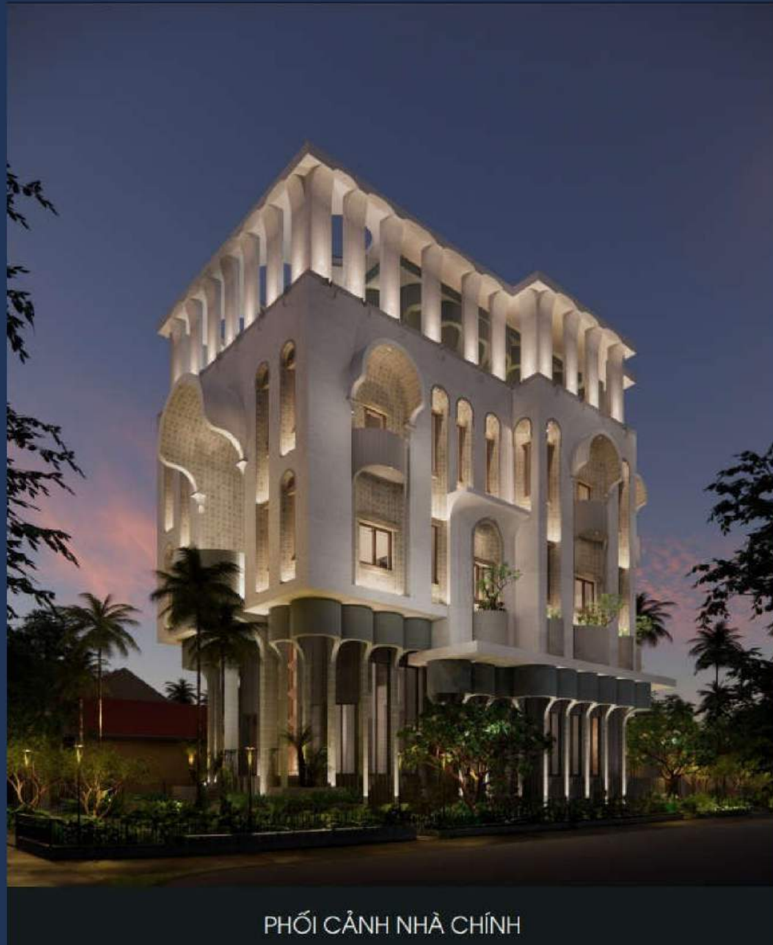
PHỐI CẢNH NHÀ CHÍNH

Thời gian thực hiện : Đang thi công từ tháng 8/2022